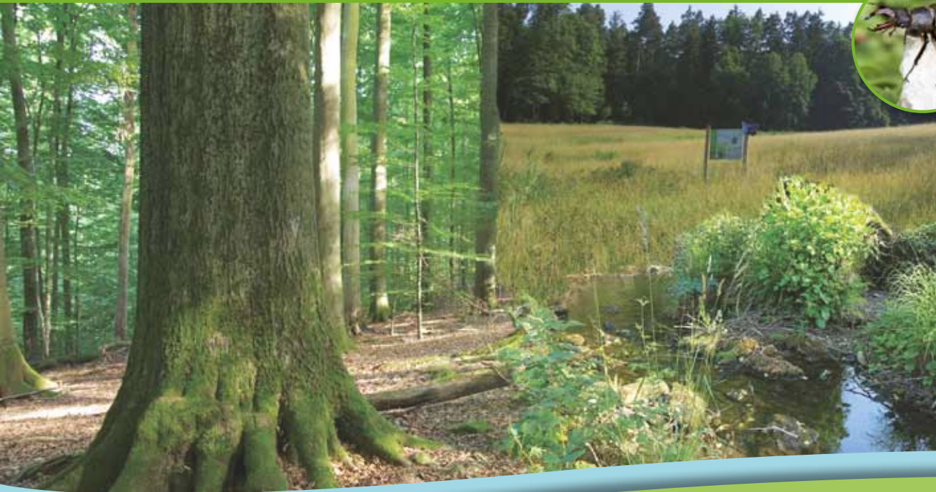
Layout: scriptus-ebrach.de Fotos und Illustrationen: Kathrin Michaelis, fotolia.com